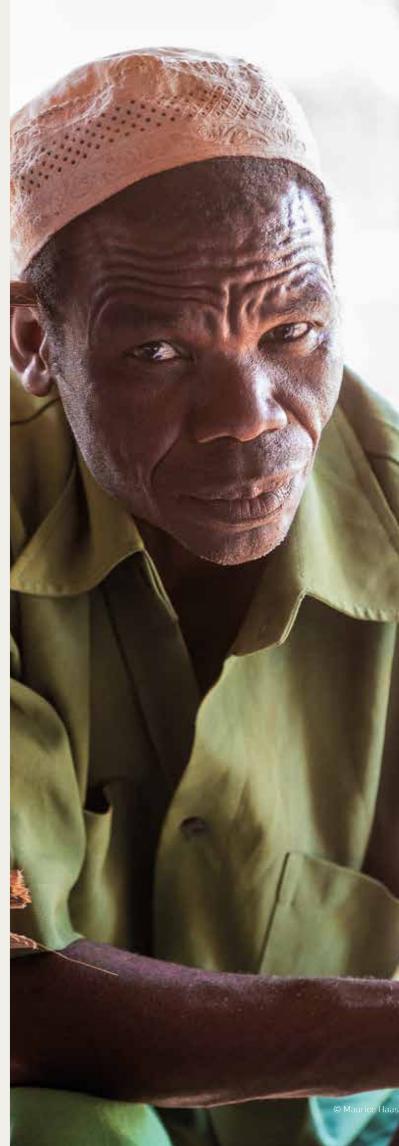
Moçambique Solarzellen für kühles Blut