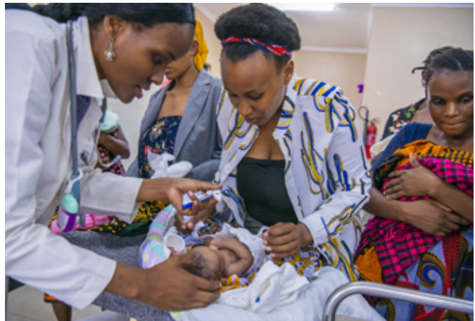
▲ Die Mütter besuchen das Spital nach Austritt weiterhin wöchentlich für einen Gesundheitscheck. ob

* Zahlen stammen aus der Baseline-Studie im Jahr 2021.