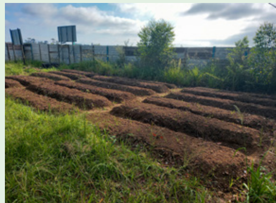
▲ Der Garten beim Gemeinschaftszentrum von Jika Uluntu sorgt für frisches Gemüse und dient als Unterrichtsort.