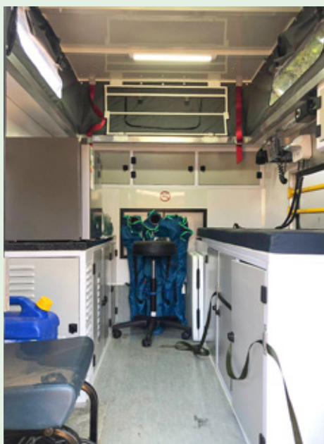
▲ Der umgebaute Geländewagen ist mit den notwendigsten Geräten und Medikamenten ausgestattet.