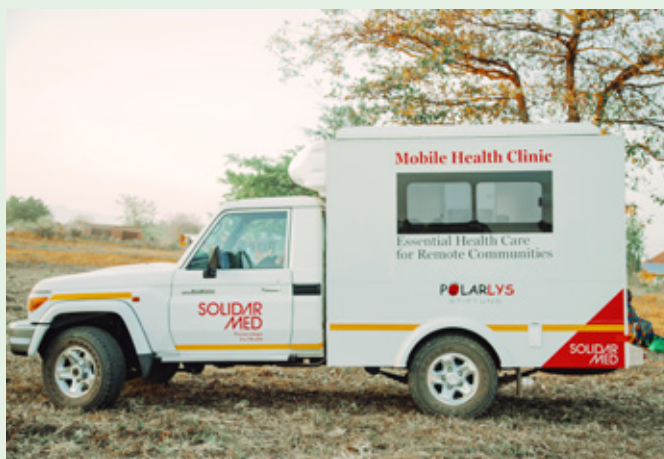
▲ Ende September nahm das Team die von der Polarlysstiftung finanzierte mobile Praxis im Malinyi-Distrikt in Empfang.