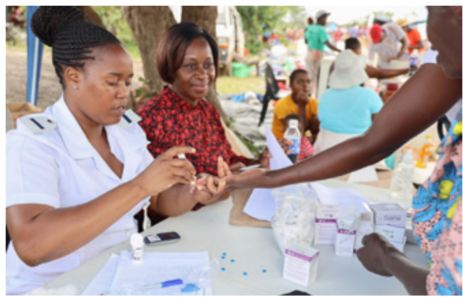
▲ Zur verbesserten Diabetes-Versorgung gehören auch Aufklärung und kostenlose Blutzuckertests wie hier in Bikita, Simbabwe.

All diese Massnahmen müssen lokal angepasst sein. In Lesotho setzt SolidarMed zusammen mit der Stiftung «World Diabetes Foundation» und vielen weiteren Partnern auf sogenannte Dorfgesundheitsberatende. Sie sind das Bindeglied zwischen Gesundheitseinrichtungen und Dorfgemein-