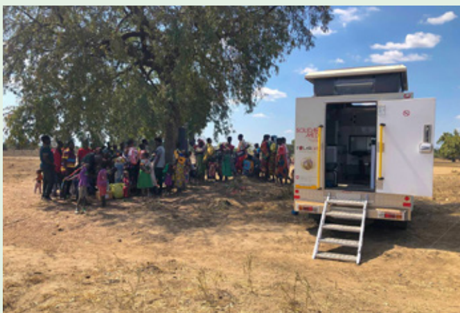
▲ Für die Bevölkerung aus den abgelegenen Dörfern im Malinyi-Distrikt macht die mobile Praxis einen grossen Unterschied.